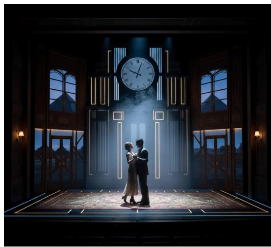
Immagine generata con IA