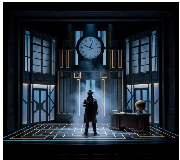
Immagine generata con IA