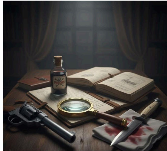
Immagine generata con IA