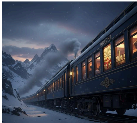
Immagine generata con IA