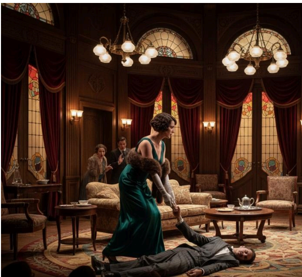
Immagine generata con IA